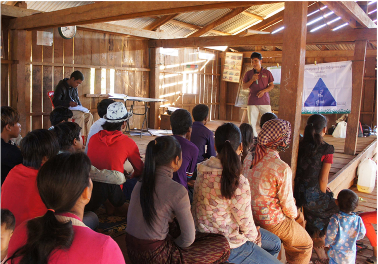
Vahva Perusta-työpaja Om-kylän tampoannuorille. Kuva ICC iBCDE